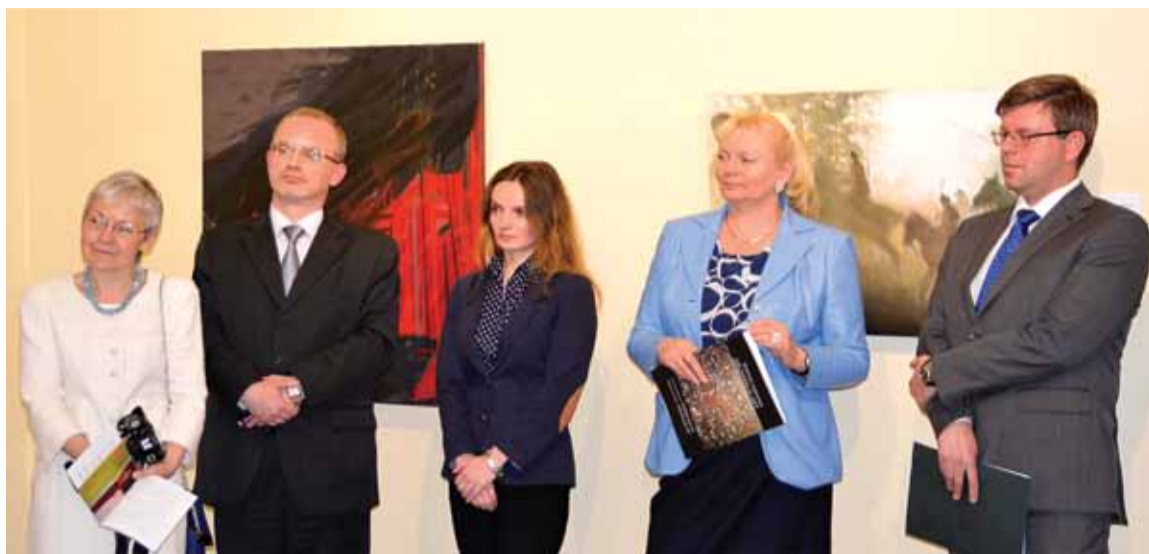
Goście i gospodarze wystawy

Ambasador Republiki Litewskiej na Ukrainie Marius Janukonis podkreślił, że upamiętnienie Bitwy pod Grunwaldzkiej wnosi znaczący wkład w budowę cało-