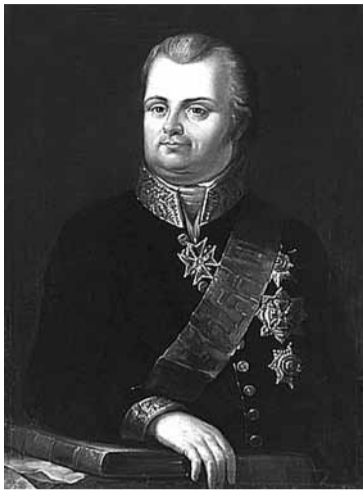
Tomasz Antoni Wawrzecki

*) Tomasz Antoni Wawrzecki herbu Rola (7 III 1759 - 5 VIII 1816) - z nominacji Stanisława Augusta chorąży wielki litewski, zwolennik reform, aktywny poseł Sejmu Czteroletniego z powiatu brasławskiego, członek Zgromadzenia Przyjaciół Konstytucji Rządowej i uczestnik wojny polsko-rosyjskiej 1792. Podczas powstania kościuszkowskiego fundator walki zbrojnej, organizator i dowódca na Żmudzi i w Kurlandii, radca i pełnomocnik Rady Najwyższej Narodowej, od 16 października 1794 generał lejtnant. Po klęsce pod Maciejowicami i pojmaniu Kościuszki został naczelnikiem insurekcji (mianowany decyzją Rady Najwyższej Narodowej z poręczenia H. Kołłątaja). Wraz z gen. Zajączkiem kierował działaniami wojskowymi w dalszej fazie powstania. Po ostatnich próbach oporu w Warszawie, rzezi Pragi i kapitulacji wycofał się z pozostałym wojskiem pod Radoszyce, gdzie 16 listopada ostatnie oddziały powstańcze uległy rozproszeniu.