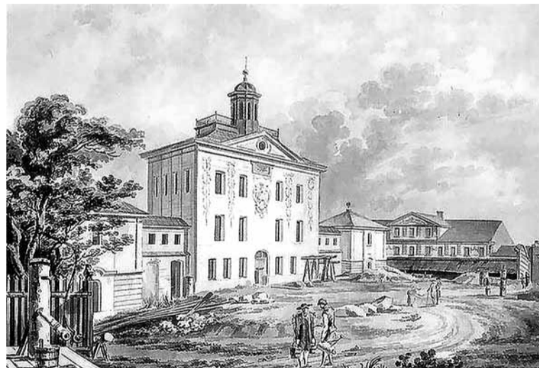
Widok biblioteki Załuskich. Zygmunt Vogel

♦ 14 X gen. Jan Henryk Dąbrowski rozpoczął odwrót z Wielkopolski;