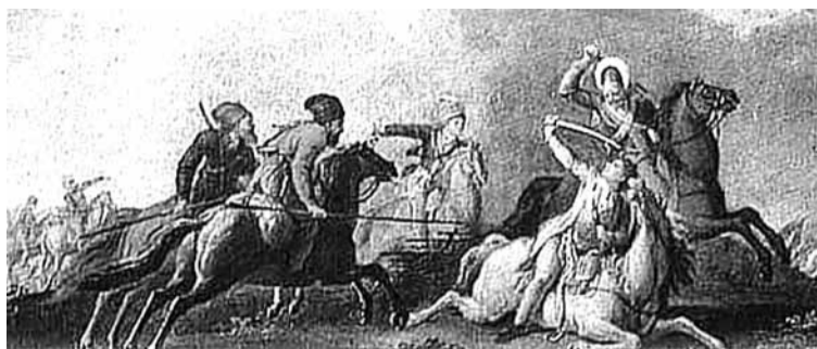
Kościuszko pada ranny w bitwie pod Maciejowicami. Jan B. Piersch

♦ 17 IX klęska dywizji Karola Sierakowskiego w bitwie pod Krupczycami z korpusem