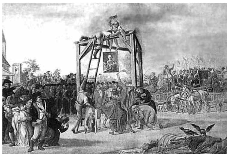
Wieszanie zdrajców. Jan Piotr Norblin

W ciągu 8 miesięcy powstania, strona polska zmobilizowała do walki około 150 tys. ludzi, z tego blisko 100 tys. do służby w oddziałach regularnych, 50 tys. służyło w milicji i pospolitym ruszeniu. W obozach i w powstańczych oddziałach liniowych przebywało 70 tys. ludzi. Na Syberię zesłano około 20 tys. powstańców. Generałowie rosyjscy w nagrodę