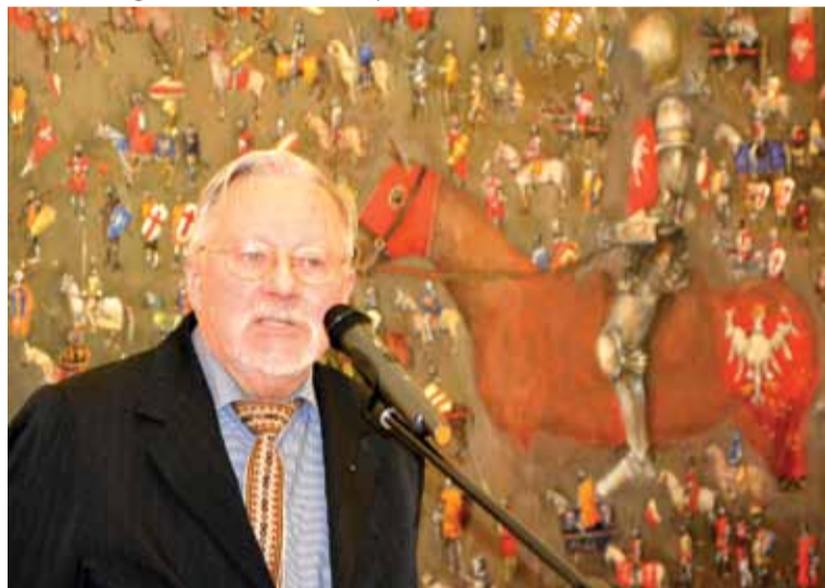
Gość z Litwy - legendarny przywódca odrodzenia litewskiej niepodległości Vytautas Landsbergis

W przemówieniu na inauguracji projektu zastępca Ambasadora Rzeczypospolitej Polskiej na Ukrainie Dariusz Górczyński powiedział m. in.: „Сьогодні ми зібралися в колі друзів України, в перлині української культури - Національному заповіднику Софії Київській, яка прийняла виставку «Грюнвальд-Арт». Ми - нащадки тих,