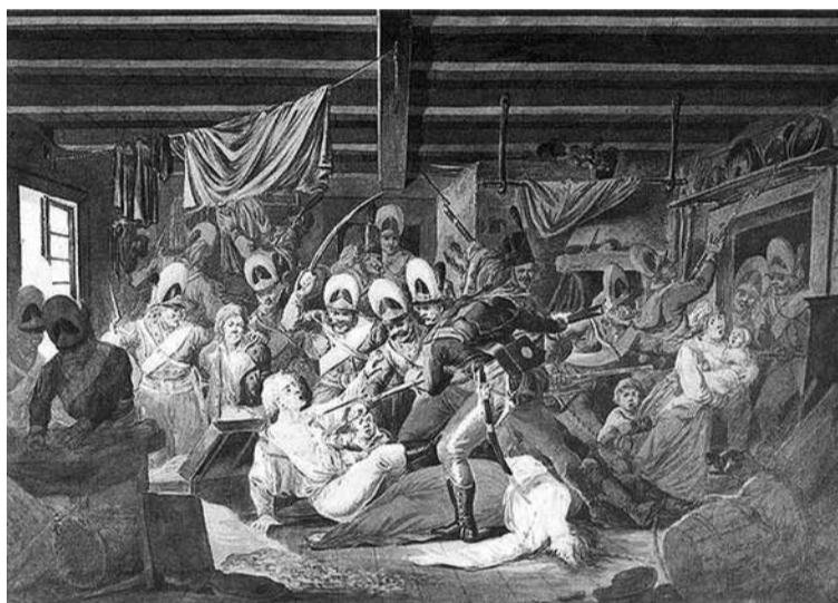
Rzeź Pragi. Aleksander Orłowski

24.X.1795 r. Rosja, Prusy i Austria dokonały III rozbioru Polski. Szczególnie „subtelne” życzenie spopielenia Polski