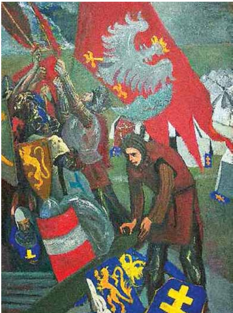
Motywy powtarzającym się w wielu obrazach są rycerze - oto woje wśród sztandarów - niczym szkic zrobiony na miejscu bitwy, autorstwa Grzegorza Wnęki

яки 600 років тому здобули перемогу над силою, котру в середньовіччі здавалося неможливо подолати. Думаю, що це дуже символічно, адже ці історичні художні імпресії нагадують, що спільними зусиллями можливо досягти як величезних успіхів, так і величезних перемог”.